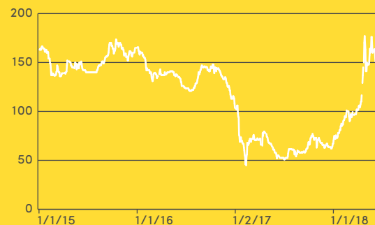
Akkumulerat överskott (TWh)